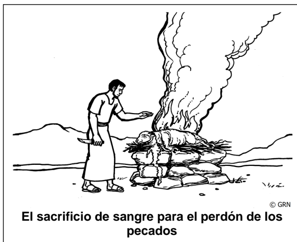
El sacrificio de sangre para el perdón de los pecados

Las instrucciones para ofrecer un animal en sacrificio ante Dios en el