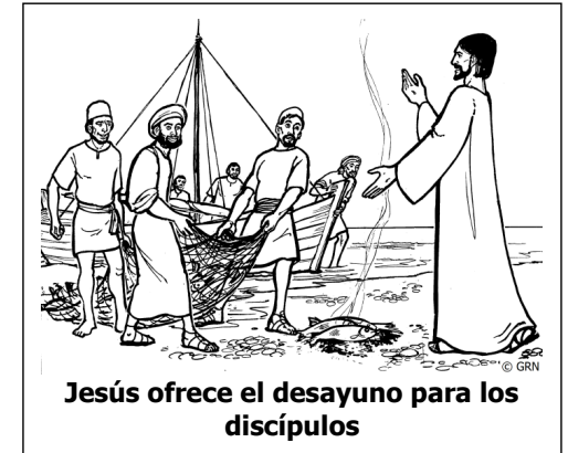
Jesús ofrece el desayuno para los discípulos

Jesús tomó el pan y se lo dio. Hizo lo mismo con el pescado. Esta fue la tercera vez que Jesús se apareció a sus discípulos después de haber resucitado de entre los muertos" (21:13-14).