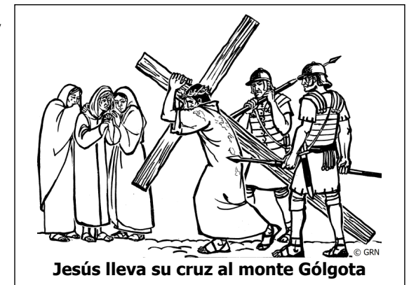
Jesús lleva su cruz al monte Gólgota

Al rechazar a Jesús como su Mesías, los judíos abrieron el camino de Dios para la muerte y resurrección del Salvador del mundo, ¡pero perdieron el control de su propia Tierra Prometida durante casi 1900 años!