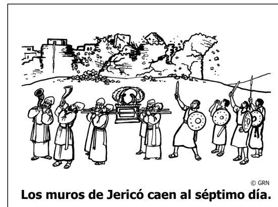
© GRN Los muros de Jericó caen al séptimo día.

Rahab y su familia tuvieron que permanecer fuera del campamento de Israel hasta que estuvieran 'limpios'. Esta fue una regla de Moisés (6:23). Entonces Rahab y su familia entraron en el campamento y se convirtieron en ciudadanos de Israel. Dios no solo salvó a Rahab, sino que le dio un honor especial. ¡Esta prostituta extranjera se convirtió en antepasada de Jesucristo! (Lucas 3:32). Ese era un plan especial de Dios, que el pueblo de Israel realmente no podía entender en ese momento.