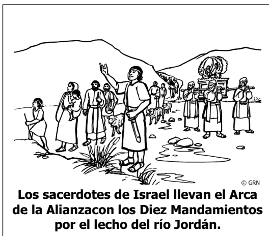
Los sacerdotes de Israel llevan el Arca de la Alianza con los Diez Mandamientos por el lecho del río Jordán.

El pueblo creyó lo que Dios le dijo a Josué. Ellos obedecieron y