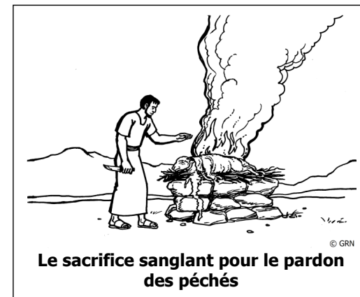
Le sacrifice sanglant pour le pardon des péchés

Quand Moïse et Aaron eurent fait tout ce que Dieu leur avait demandé, Aaron leva les mains vers le peuple et le bénit (9.22). Puis il entra dans la Tente de la