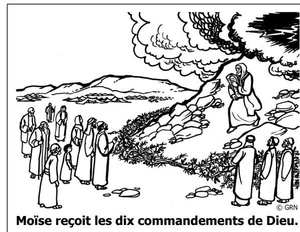
Moïse reçoit les dix commandements de Dieu.

Il est utile d'essayer de comprendre POURQUOI Dieu a donné des lois écrites à son peuple. Les Israélites avaient déjà le témoignage oral et écrit d'Abraham, d'Isaac, de Jacob et de Joseph. Au temps de l'Exode, ils étaient aussi soumis aux lois égyptiennes, dont certaines étaient injustes et cruelles. Il leur fallait une révélation divine qui leur permette de choisir le bien et de rejeter le mal : Dieu la leur donna