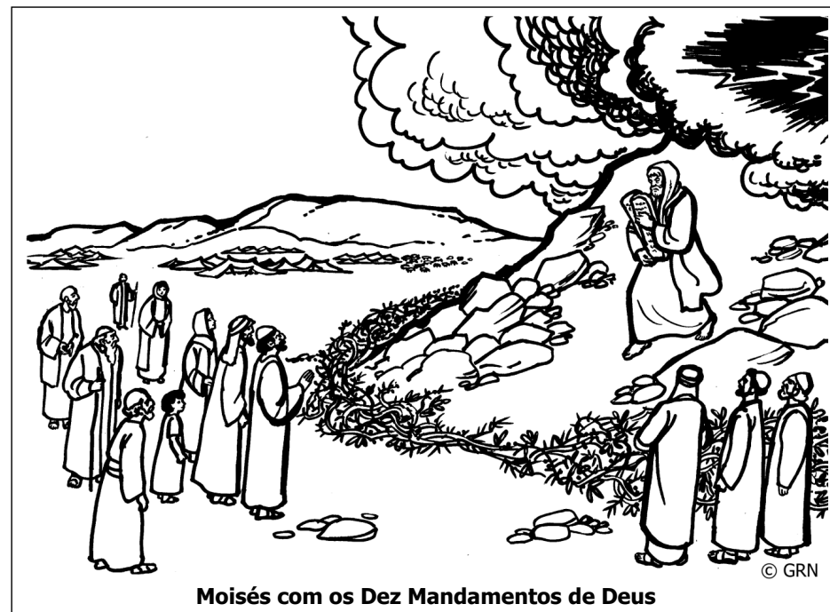
Moisés com os Dez Mandamentos de Deus

As leis de Deus nos encorajam a cuidar do que nós e os outros possuímos e a ter cuidado com o que fazemos, para que as pessoas e as coisas ao nosso redor não sejam feridas ou danificadas. Estas nos encorajam a cuidar do mundo em que vivemos. Deus quer que cuidemos do mundo que Ele criou (Génesis 2:15).