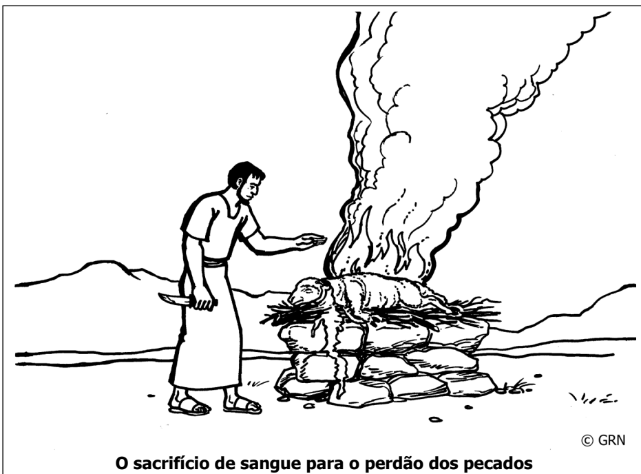
O sacrifício de sangue para o perdão dos pecados

No terceiro mês depois de deixar o Egito, o povo de Israel acampou no deserto em frente ao Monte Sinai (Êxodo 19:1-2). Foi ali que Deus chamou toda a tribo de Levi para servi-Lo como sacerdotes. Eles ensinaram aos Israelitas a maneira como Deus queria que eles O adorassem naquele tempo. Os sacerdotes aceitavam os sacrifícios do povo a Deus de animais, pássaros e também alimentos (Levítico 1:9,13,17).