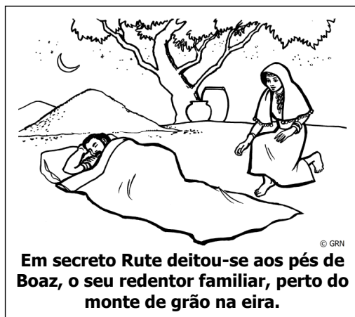
Em secreto Rute deitou-se aos pés de Boaz, o seu redentor familiar, perto do monte de grão na eira.

Rute mudou a sua roupa. Os seus dias de luto já tinham terminado. Ela estava pronta para aceitar o redentor familiar. Naquela noite, ela lavou-se e perfumou-se e foi para o campo da ceifa. Boaz adormeceu perto do monte de grão. Sossegadamente Rute deitou-se aos pés dele. Ela espalhou a beira da capa sobre si mesma. Dessa forma, sem pronunciar nenhuma palavra, Rute convidou Boaz para a proteger.