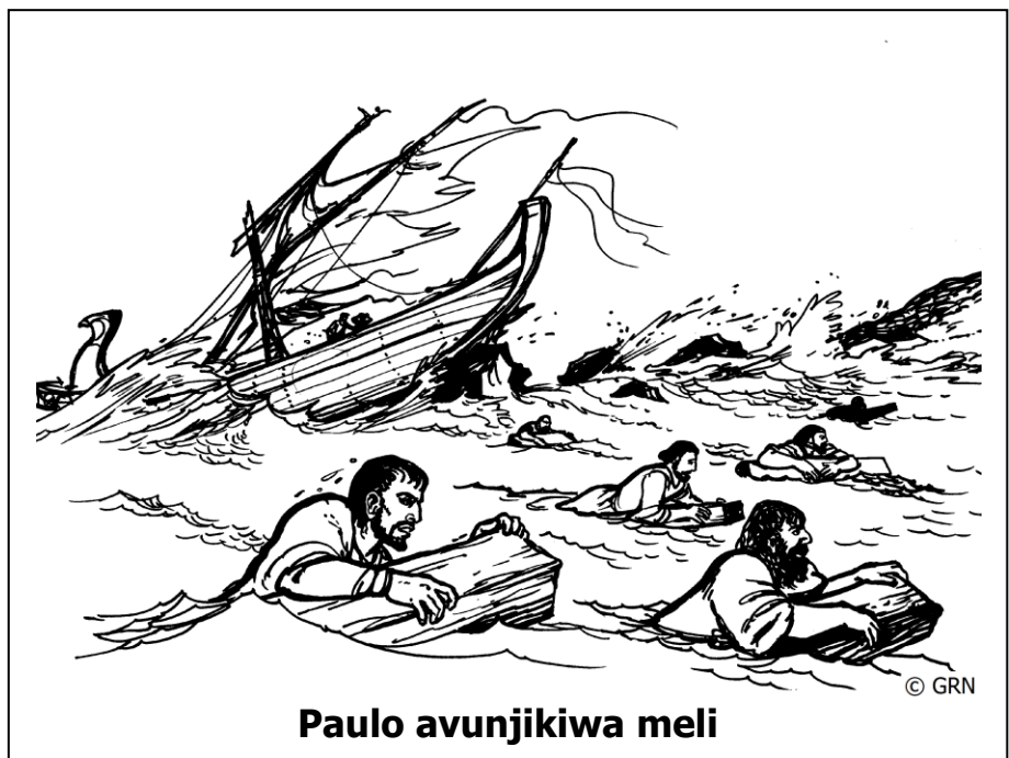
Paulo avunjikiwa meli

Meli ikashikwa na tufani kuu, na kuwapeleka mbali na nchi kavu. Mabaharia wakatupa kila kitu baharini ili meli ipunguze uzito na