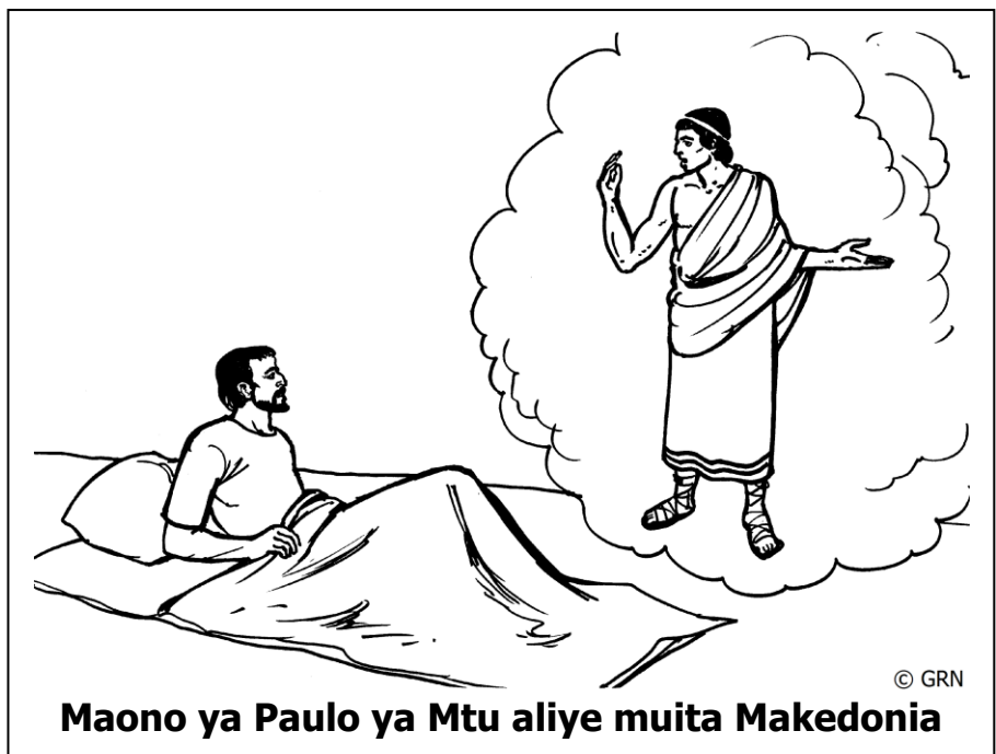
Maono ya Paulo ya Mtu aliye muita Makedonia

ikaongezeka kila siku (Mdo.16:5). Baadaye wakaenda kwenye miji ambayo Paulo alikuwa hajaifikia.