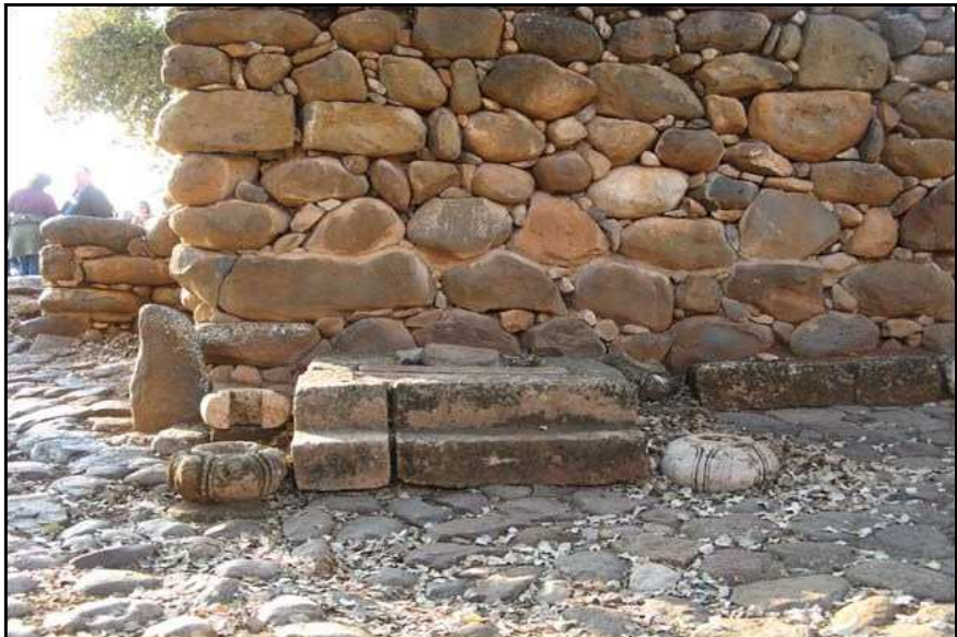
Une photo d'un ancien siège du tribunal à la porte de Dan en Israël. La porte est derrière le mur.

Jourdain (20 :2). Les meurtriers involontaires pouvaient s'enfuir dans l'une d'entre elles et y rester jusqu'à leur jugement. Les Lévites devaient se charger d'eux. Ils étaient ainsi protégés des repréailles de la famille des victimes qui voulait les tuer (Nombres 35 :6, 13, 15).