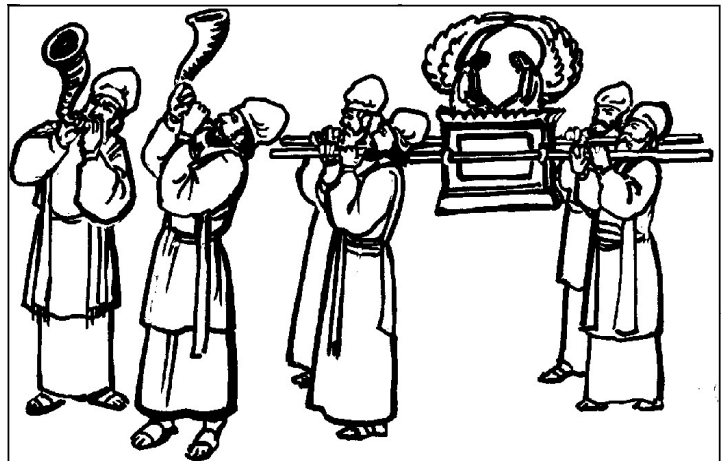
Les prêtres d'Israël portaient l'Arche de l'Alliance qui contenait les Dix Commandements.

Le peuple prit au sérieux les paroles de Josué. Il obéit et se tint prêt