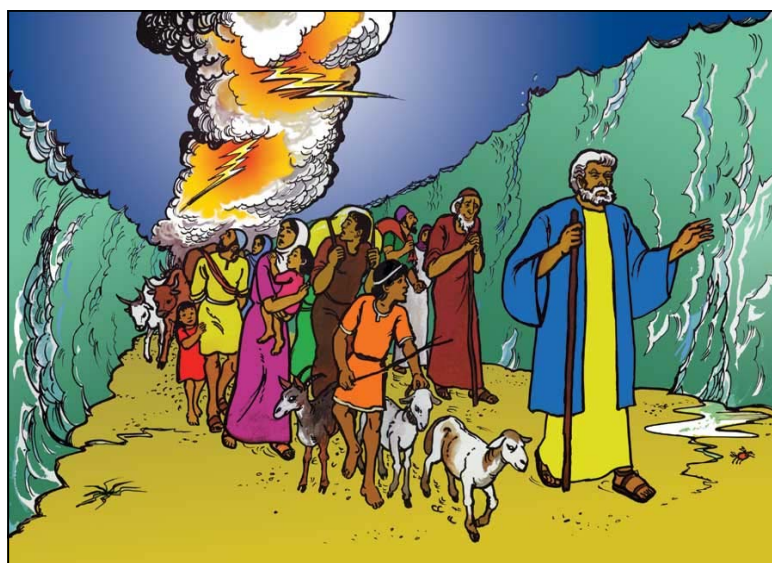
Traversant la Mer Rouge avec la colonne de nuée derrière eux

Dieu ne leur révéla pas tout ce qui leur arriverait si ce n'est ce qui pourrait les fortifier.