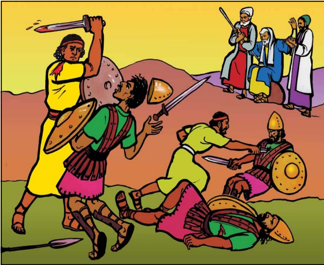
Joshua gagne la bataille pendant que Moïse élevait le bâton de Dieu

Moïse envoya Josué et ses guerriers pour leur faire la guerre. Ce fut le premier combat de Josué qui apprit à se confier en Dieu dans l'épreuve. Lui et ses hommes gagnèrent la bataille parce que leur chef, Moïse, élevait la verge de Dieu pendant qu'ils combattaient. Quand Moïse était fatigué et que ses mains retombaient, les Israélites perdaient. Aussi Aaron et Hour soutinrent-ils ses bras chacun d'un côté (17 :12). C'est le chef Moïse que Dieu choisit pour aider le peuple à vaincre l'ennemi. Dieu aurait pu vaincre