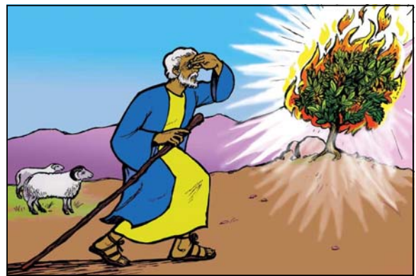
Moïse et le buisson en feu qui ne se consumait pas

Rappelons-nous que Dieu avait prévu de faire d'Israël un peuple à part, qui devait quitter la terre promise pendant 400 ans pour y revenir à jamais. Pour cela, il devait laisser derrière lui les dieux d'Egypte, apprendre à vivre dans la sainteté et n'adorer que le seul vrai Dieu vivant : Yahveh.