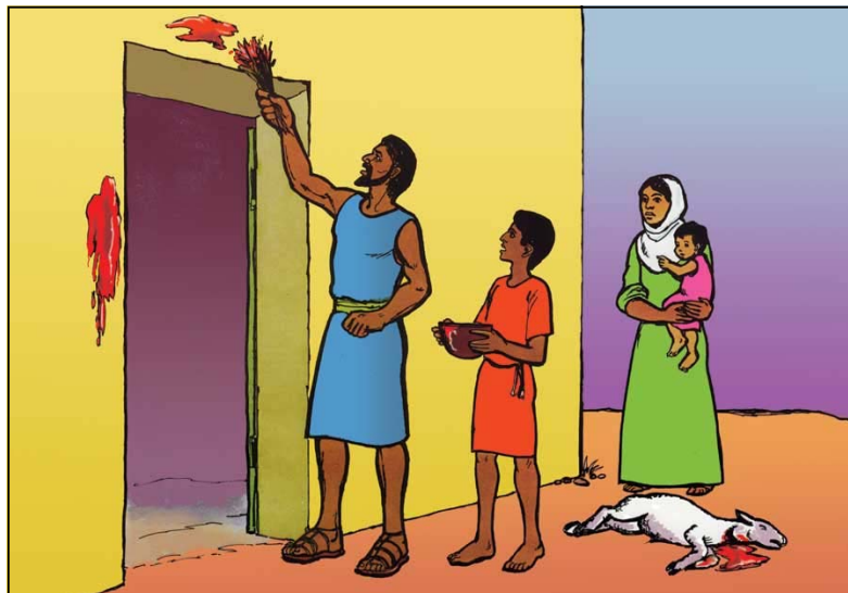
Mettant du sang sur les montants et le linteau de la porte

La Pâque était si importante que Dieu commanda de la commémorer chaque année d'une façon toute spéciale. Lisez-le dans Nombres 9 :2-3 ; Josué 5 :10 ; 2 Chroniques 30 :1 ; 35 :1 ; Esdras 6 :19 ; Luc 2 :41 ; Jean 2 :13.