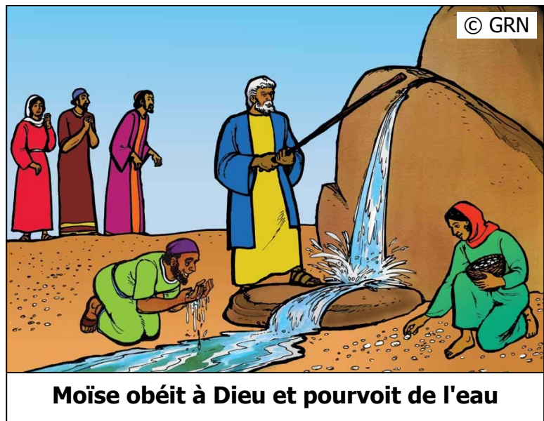
Moïse obéit à Dieu et pourvoit de l'eau

Les Israélites avaient provoqué l'Éternel pour voir s'Il était ou non avec eux (17 :7). Dieu répondit par un courant d'eau, pur, limpide, qui leur redonna vie.